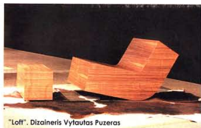
“Loft”. Dizaineris Vytautas Puzeras

Kovo pabaigoje renginio “Dizaino savaitė” baigiamajame vakarėlyje “Absolut Afterparty” paskelbti ryškiausi Lietuvos dizaino talentai - baldų dizaino konkurso [neformate], “Metų interjeras” nugalėtojai ir Metų dizaino žmogus.