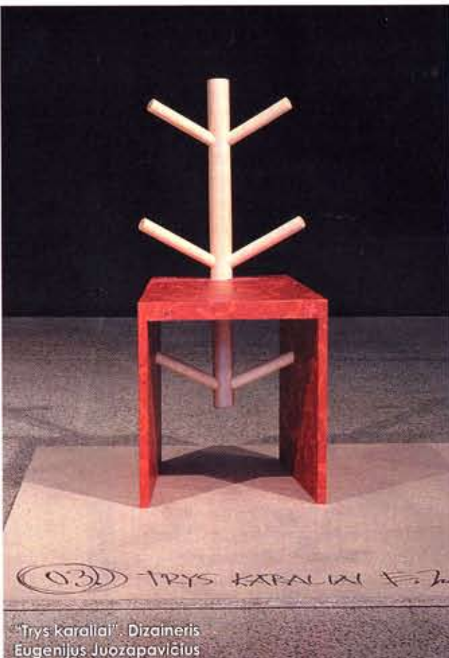
“Trys karaliai”. Dizaineris Eugenijus Juozapavičius