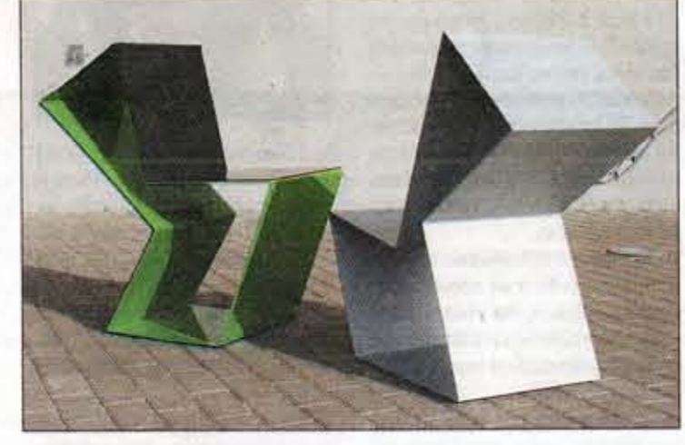
Studija LTD. Kėdė LYA