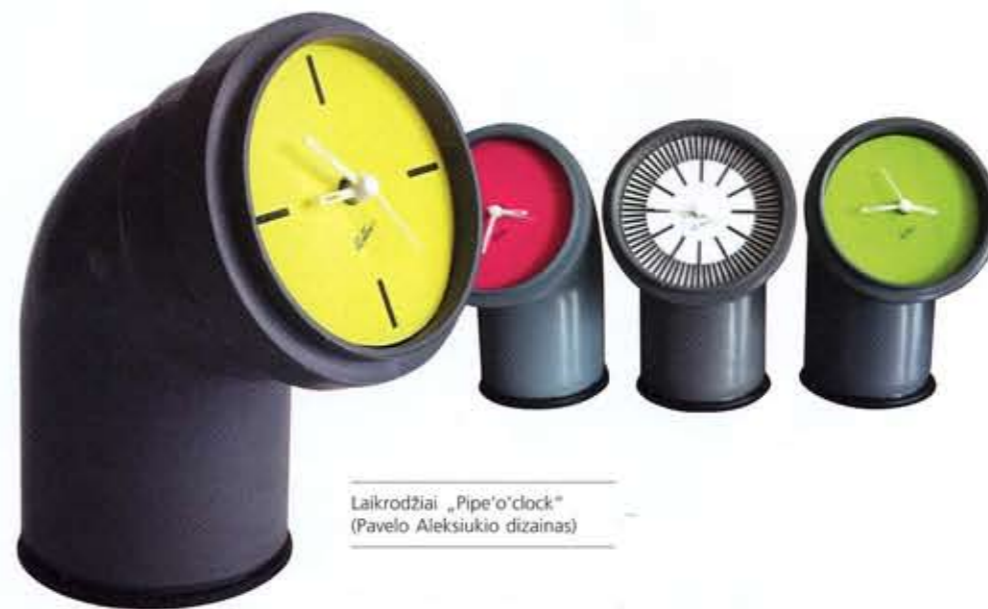
Laikrodžiai „Pipe'o'clock“ (Pavelo Aleksiukio dizainas)