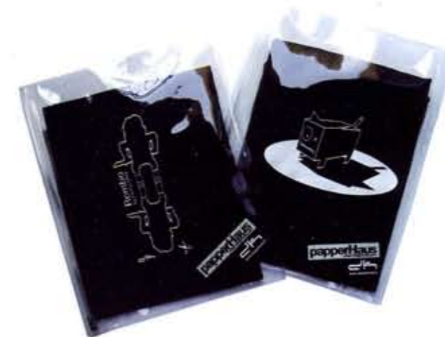
Marškinėliai su „paperHaus“ atributika (studijos „DesignHotel“ dizainas)