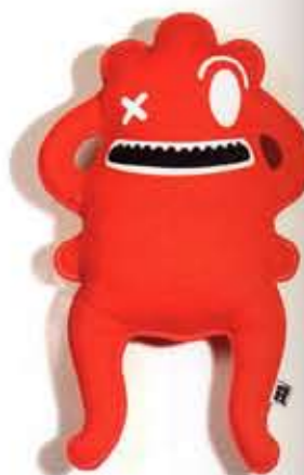
Lelė („MOYTOY“ dizainas)