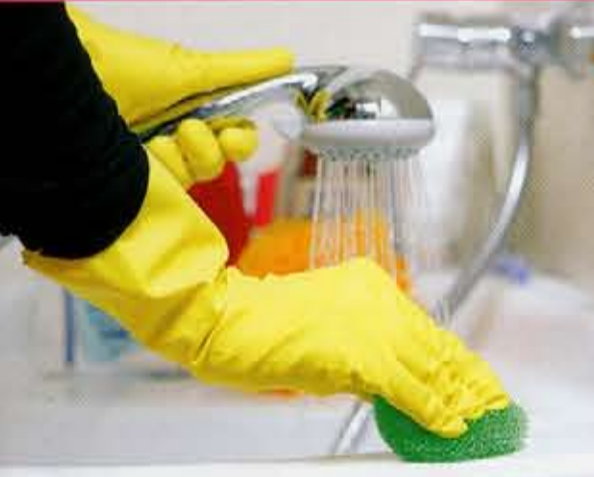
● Namų tvarkytojos - poniška užgaida ar būtinybė?