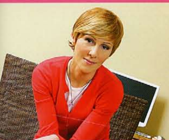
● TV laidos vedėjai - interjero dieta