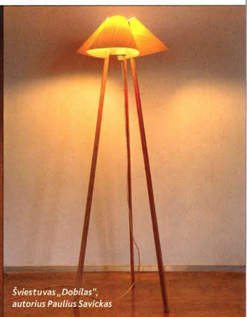
Šviestuvai „Dobilas“, autorius Paulius Savickas