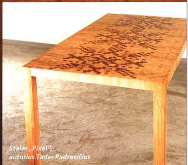
Stalas „Pixel“, autorius Tadas Radzevičius